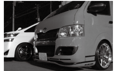
色を塗り替え。エアロパーツはオリジナルパーツ。エアロパーツとは…車のボディ外部に取り付けるパーツのこと。