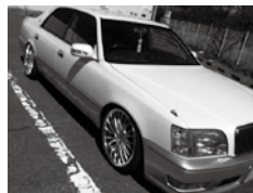
映画の劇用車として使用されたこともあります。

私の乗り物好きは主に父親の影響で、父も昔から愛車をカスタマイズしていて、親子で同じ趣味ということで、取り付けるパーツなどで好みがかれ口喧嘩気味になることもあります。