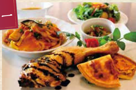
野菜たっぷりスペシャルプレート 1,500円