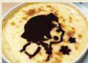
特製ハイジの アートドリア 1,200円