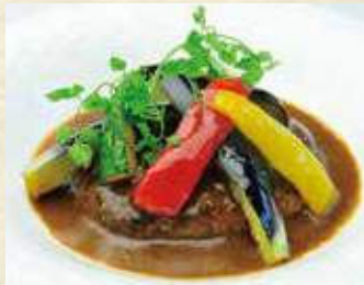
ワインビーフの ハンバーグ 野菜添え 1,200円