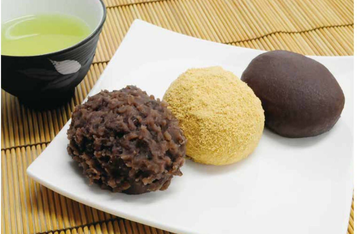
桔梗屋「萩の餅」 詳細は2面へ