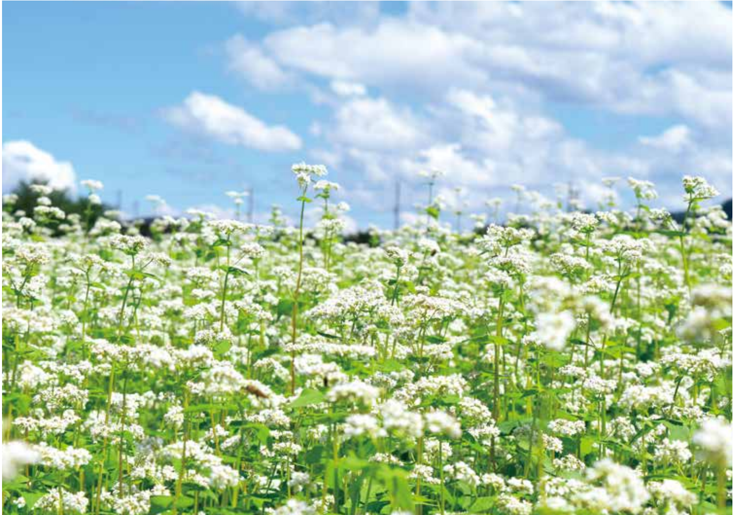
ハイジの野菜畑富士吉田ファーム「秋そば」