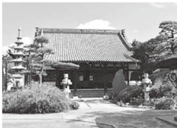
現在の尊鉢寺（甲府市城東1丁目）

時は流れ、慶応四（一八六八）年、御一新（明治維新）を迎え、戊辰戦争が勃発した。新政府の官軍と、旧幕府軍との戦いである。三月四日、中山道軍参謀板垣退助（のち自由民権運動を興す）率いる官軍が甲府城を占領、この日から土佐・因幡・諏訪・高遠藩の軍勢が甲府を官軍の管理下に置く。