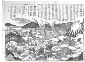
「甲府大功記」官軍と近藤勇軍との戦いを伝えるもの（山梨県立博物館所蔵）

甲府の中心街から、かつての甲州道中（国道四一―号）を東に進む。城東一丁目まで北に直角で折れる所の東側には広い敷地を持つ尊鉢寺がある。元々は武田信虎が柳小路（江戸時代の元柳町、現武田三丁目）に創建した寺で武田氏の滅亡後、徳川家康が甲府に来た時には必ずここに本陣を置いたという。甲府城の竣工時に現在地に移された。