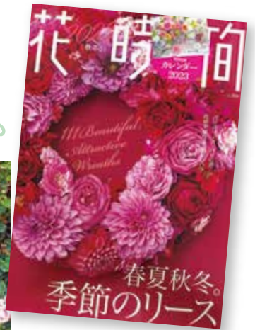
flower/ 宿澤毅 長田美穂 table coordinate/ 中丸恵

「高原のガーデンパーティ」という特集で、計8ページにわたり掲載されています。 ハイジの村で摘んだバラで作ったリースは、Dolce vitaのスタッフが作成しました。