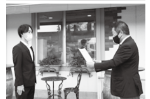
10.13（木）山梨フルーツ王国で行われた表彰式の様子