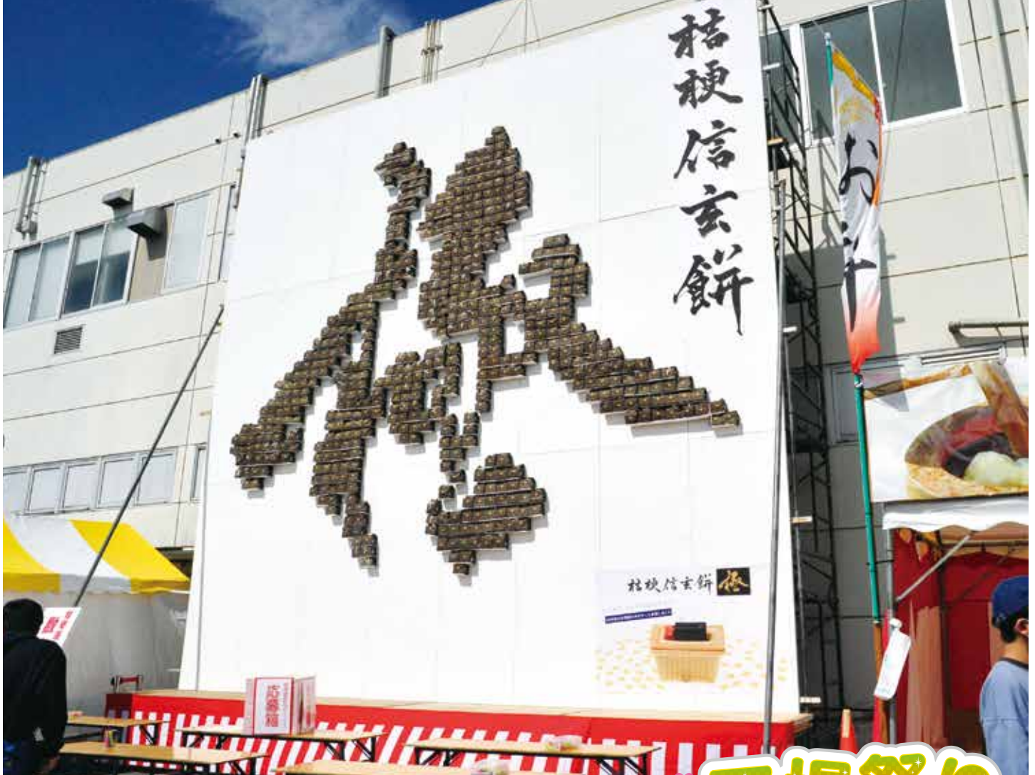
桔梗屋工場祭り「数当てクイズ」 写真は昨年为数当てクイズです