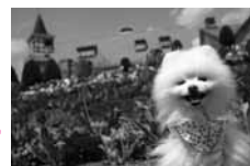
5月:ゴールド賞 枝様「笑顔満開」 テーマ「愛犬と楽しむ春」