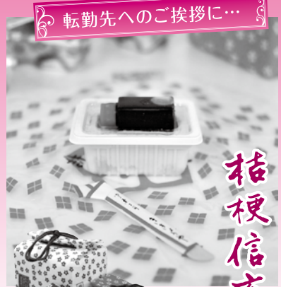
転勤先へのご挨拶に...