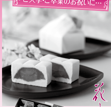
ご入学・ご卒業のお祝い...