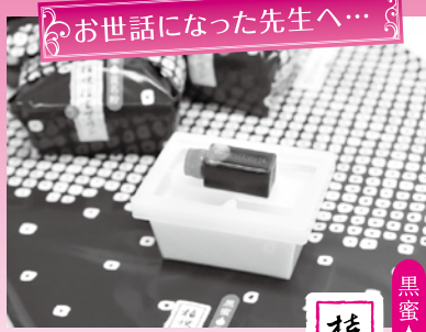
お世話になった先生へ...