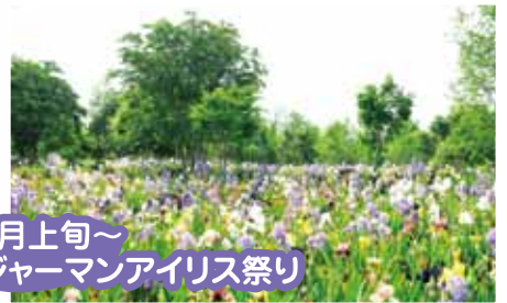
5月上旬～ ジャーマンアイリス祭り