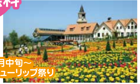
4月中旬～ チューリップ祭り