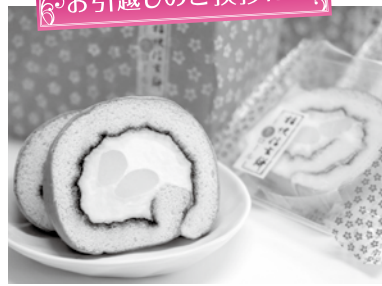
お引越しのご挨拶に...