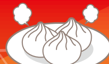
パオツ…各280円 (餡の煮貝・鳥もつ煮・富士桜ポーク)