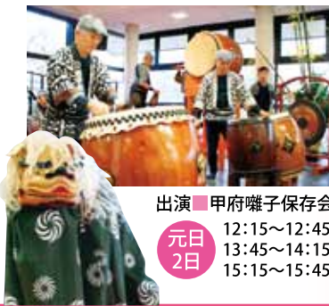
出演 甲府囃子保存会 元日 12:15~12:45 13:45~14:15 2日 15:15~15:45