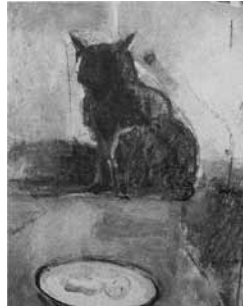
猫 奥村貞弘 富士山(ガラス絵) 矢崎稔