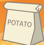
しゃかしゃかポテト…300円