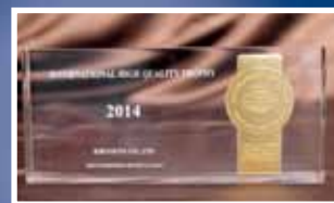
桔梗信玄餅(箱入り・布袋入り) 3年連続受賞の記念トロフィー