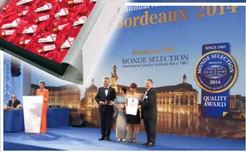
2014 モンドセレクション 表彰式