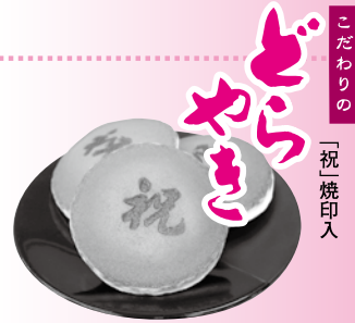
「祝」焼印入 「どらやき」